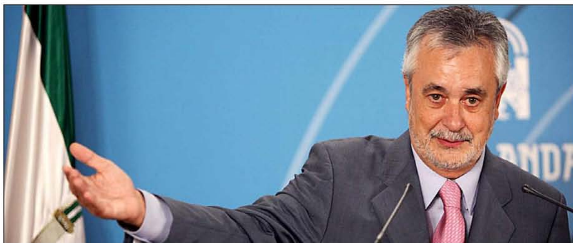
José Antonio Griñán es el presidente de Andalucía, la comunidad que acumula el mayor número de ayuntamientos incumplidores.

De hecho el 100 por ciento de los deberes hechos en ese ejercicio sólo lo presenta, una vez más, Balea-