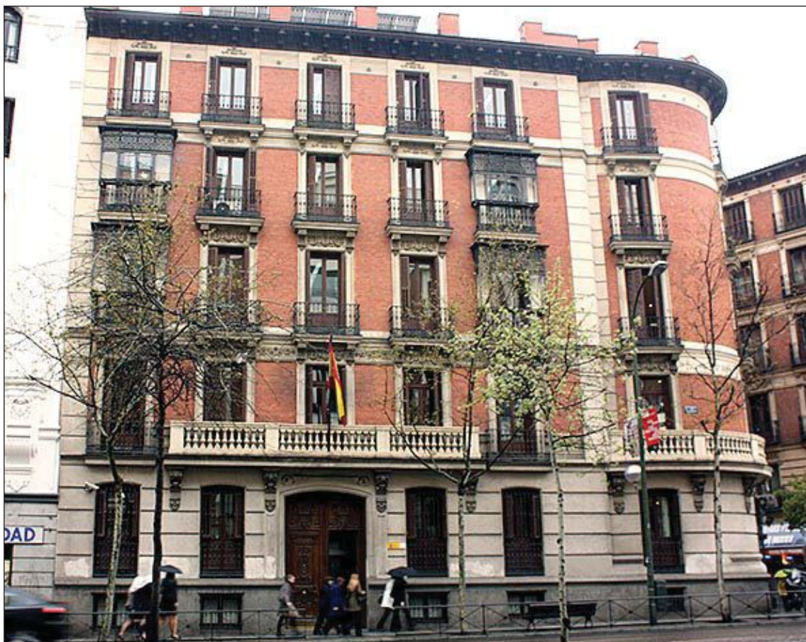
La sede del Fondo de Garantía Salarial (Fogasa). AMPARO FERNÁNDEZ

El párrafo de énfasis, se utiliza en aquellos casos en los que el auditor