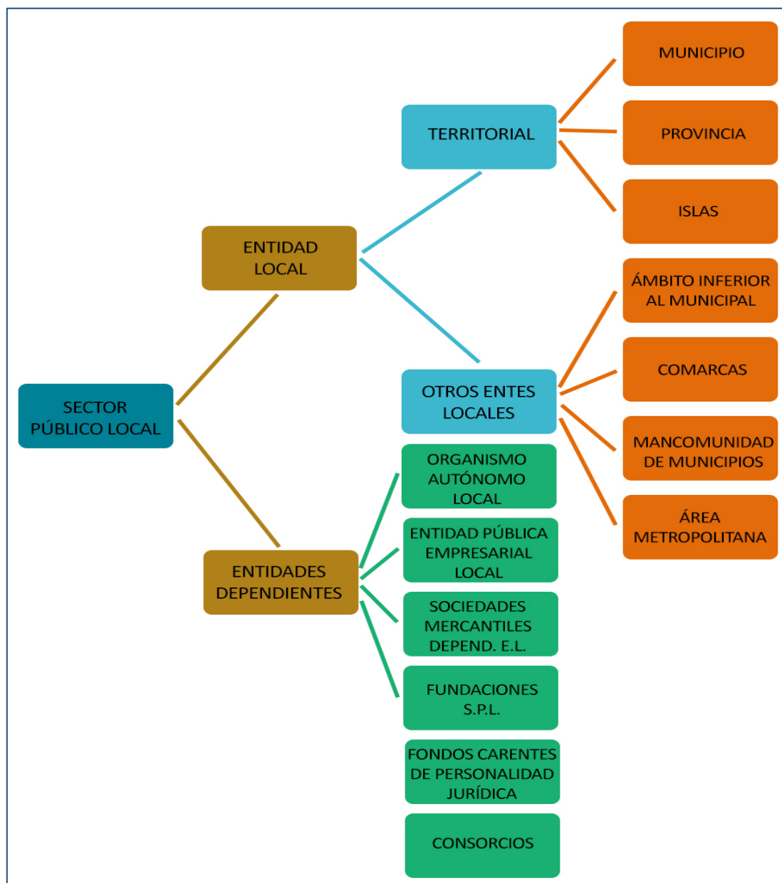
Figura nº 2. Delimitación del Sector Público Local

A modo de conclusión de todo lo anterior, podemos señalar que, la primera aproximación a una clasificación de los entes del Sector Público nos llevaría a distinguir entre Administraciones territoriales y entes institucionales.