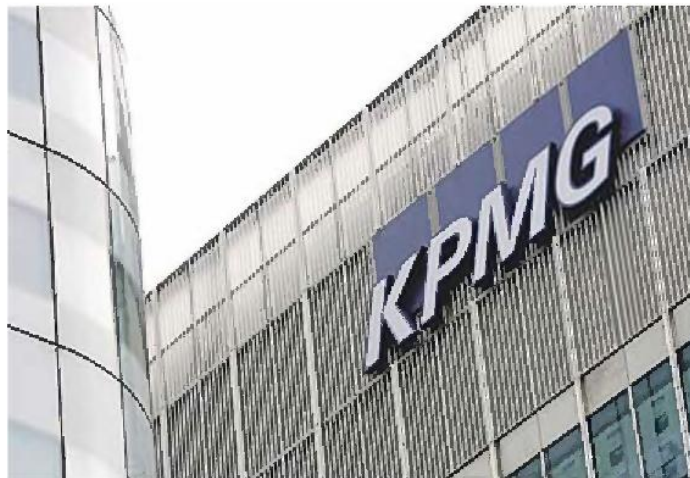
Edificio de KPMG en Londres

En la misma línea se han movido los servicios de Management Consulting y de Transactions & Restructuring, que durante el ejercicio anterior arrojó un crecimiento negativo. Sin embargo, la situación de mercado ha sido difícil para las áreas de Auditoría y Servicios Fiscales, ya que en el primer caso los resultados se han mantenido sin cambios con respecto a 2011 y en el segundo se ha registrado un crecimiento moderado del 2 por ciento. En este sentido,