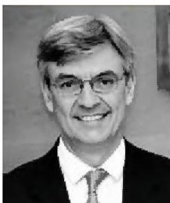
Fernando Ruiz, presidente de la filial española de Deloitte.